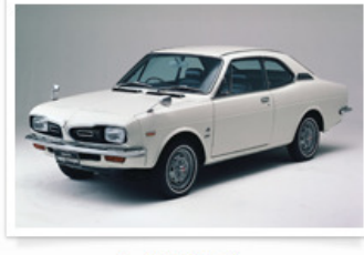
▶ 145 クーペ