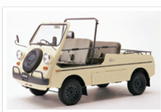
▶ パモス ホンダ