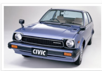
▶ シビック 3ドア ハッチバック