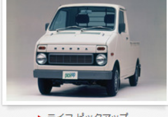
▶ ライフ ピックアップ