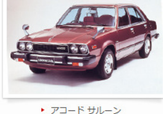
▶ アコード サルーン