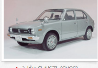
▶ シビック 4ドア (CVCC)