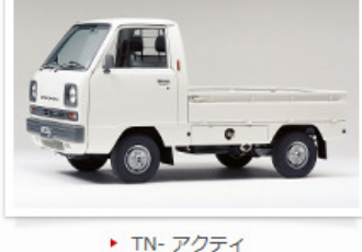
▶ TN- アクティ