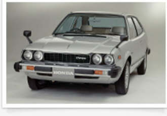
▶ アコード ハッチバック