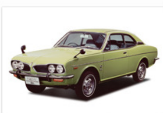
▶ 1300 クーペ