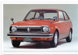
▶ シビック 3ドア