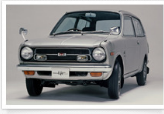
▶ ライフ ライトバン