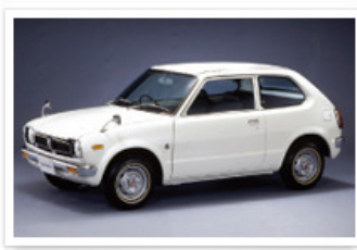
▶ シビック 2ドア