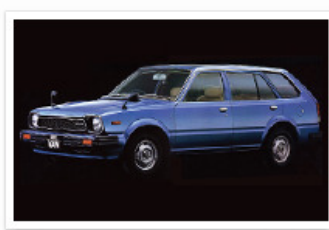
▶ シビック バン