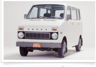
▶ ライフ ステップバン