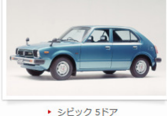
▶ シビック 5ドア