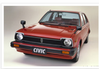
▶ シビック 5ドア ハッチバック