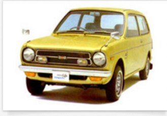
▶ ライフ ワゴン